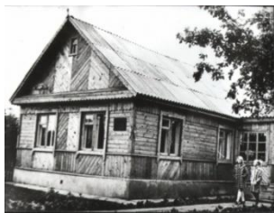
Дом-музей А.Ф. Куприяновой

50 лет назад состоялась торжественная церемония открытия мемориального комплекса на месте базирования партизанской бригады «Разгром» в урочище Стриево (начало июля 1975 г.).