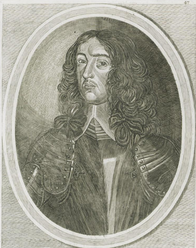
BOGUSLAVS I RADZIWIŁ DG. DUX in Birze Dabinski glucko et kopy s.R.I. PRINCEPS DOMINUS in Nevel et Sobiesz ab A o 1696 Viritis Legationibus Comitis Regni Chry. s. 1758 Suprema VEXILLIFER M.D.L. s. 1649 Supr. STABILIS PREFECTUS M.D.L. s. 1649 s.R.M. Cohortium Prefectus. E. 1657 Ducatus Praefectus Generalis ADMINISTRATOR. Baro, Branczi Passerovianus Gubernator. Regi et Reipubl. in modo Fide, Consilio ac Animi Fortitudine, veru et Opib, Suis, Proprio Ere ac Milit. ab A o 1640 contra Cossacos Tartaros s. 1655 contra Moschos. s. 1658 contra Success Contentu Periculum pfiduo seu fuit. JAN URSII V.L. s. 1620. et ELISABETHAE SOPHIAE PRINCEPIS BRANDENBURGICAE s. 1659 Rex Prp. Assultum Natur. DUCHEM RADVILIORUM CASTELLANOR. Vitis s. Borisov. Zjaskov. Hyatric. Sevrens Gubernatorum. F. H. ILLS Natus Gedani s. Maj 1620. Regiomonti Borjfer s. 4 Decembris 1667. Sepult. Istad s. Maj 1670 in Eccl. Kneiphov. in Notum Electoris Consortis Anna Maria Princeps Radvilia. Fratris Palzuelo Ianu. XI. F. Ills.