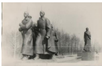
Монумент в честь советской матери-патриотки

105 лет назад при Народном комиссариате юстиции союзной республики был создан карательный отдел, ныне Департамент исполнения наказаний МВД РБ. В введении этого департамента находится ИУ «Тюрьма №8» г. Жодино (22 августа 1920 г.).