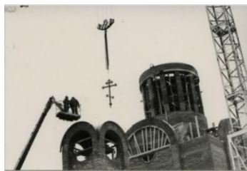
Возведение креста на главный купол Храма

25 лет назад, в день крещения Господня, был освящён и воздвигнут крест на главный купол Храма в честь иконы