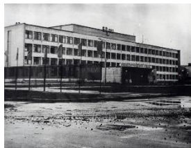
Жодинская швейно-трикотажная фабрика «Світанак»