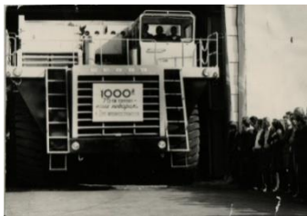
1000-я машина МАЗ-525

65 лет назад на БелАЗе была изготовлена 1000-я машина МАЗ-525 (7 ноября 1960 г.).