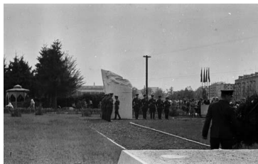
Открытие памятника П.И. Куприянову

60 лет назад был открыт памятник Герою Советского Союза П.И. Куприянову по пр. Ленина (парк имени 50-летия Белорусского автозавода) (май 1965 г.).