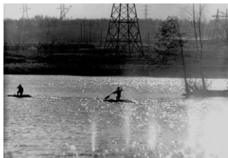
Секция гребли на байдарках и каноэ

75 лет назад отдельные могилы советских воинов и партизан, расположенные на станции и в окрестностях посёлка Жодино, были перенесены в братскую могилу на гражданском кладбище по ул. Московской. Благодаря краеведческой работе стали