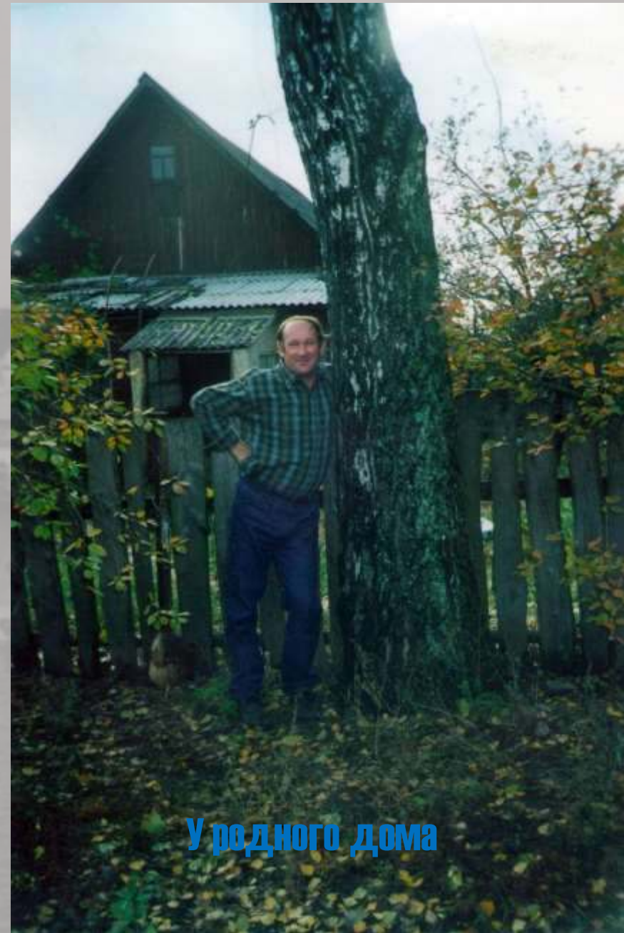
У родного дома